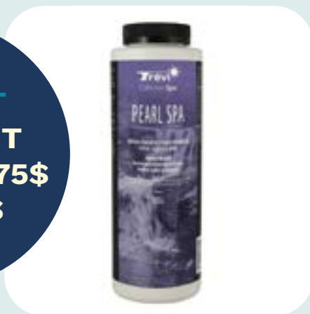
Adoucisseur et conditionneur pour l'eau des spas