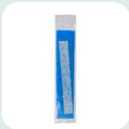
Languettes de mousse de sphaigne (Paquet de 4)