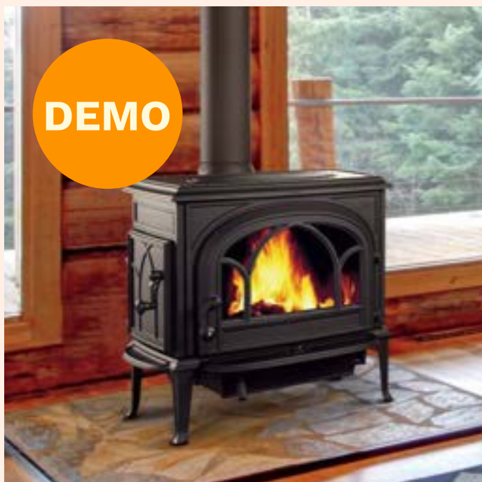
F500 Oslo V3