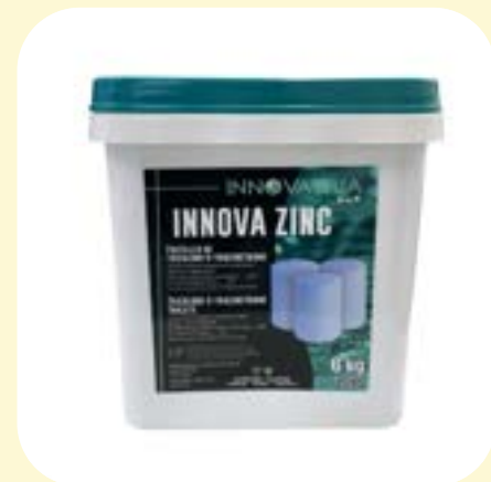
Innova zinc 6 kg