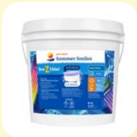
Duo Z Chlore 6 kg