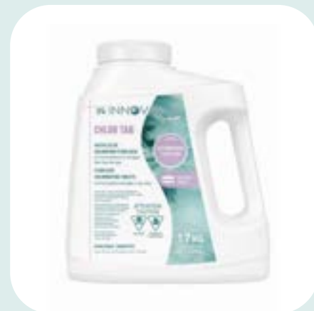
Pastilles de chlore